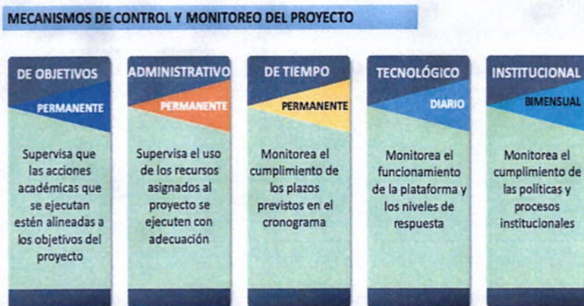
Ilustración 21 Mecanismos de control y monitoreo del proyecto

Los mecanismos de control previstos se proponen dar seguimiento a la ejecución del Proyecto en todo su conjunto con el objeto de introducir las correcciones que resultaren necesarias según el comportamiento de los equipos de trabajo y de la experiencia adquirida a lo largo del periodo objeto de control. En este caso, comprende: de objetivos, administrativo-financiero, de tiempo, tecnológico e institucional.